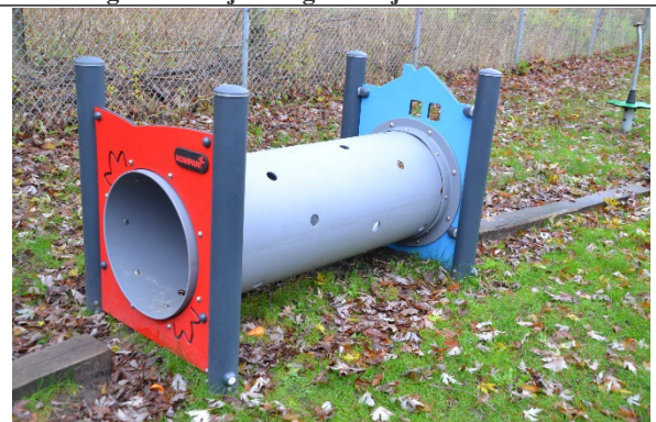
Redskab: Tunnel Årgang: 2021 Producent: Kompan Er redskabet mærket: Ja Er der registreret fejl/mangler: Nej