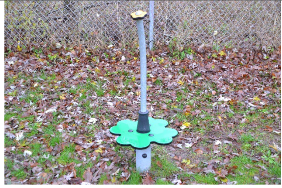
Redskab: Spinner Årgang: 2021 Producent: Kompan Er redskabet mærket: Ja Er der registreret fejl/mangler: Nej