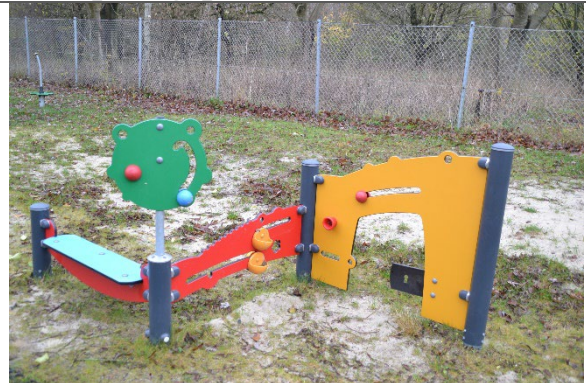
Redskab: Aktivitetsvæg Årgang: 2021 Producent: Kompan Er redskabet mærket: Ja Er der registreret fejl/mangler: Nej