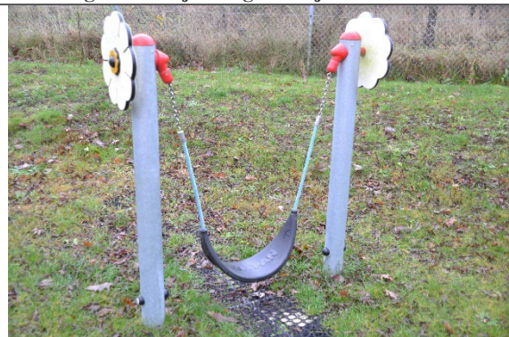
Redskab: Mavegynge Årgang: 2021 Producent: Kompan Er redskabet mærket: Ja Er der registreret fejl/mangler: Nej