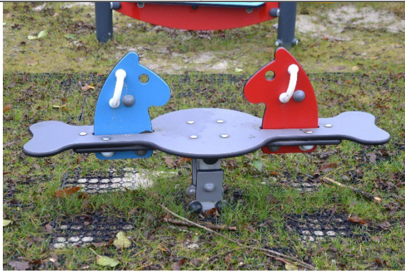
Redskab: Vippe Årgang: 2021 Producent: Kompan Er redskabet mærket: Ja Er der registreret fejl/mangler: Nej