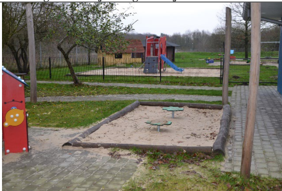
Redskab: Sandkasse med stolper til læsejl Årgang: 2021 Producent: Kompan Er redskabet mærket: Ja Er der registreret fejl/mangler: Nej