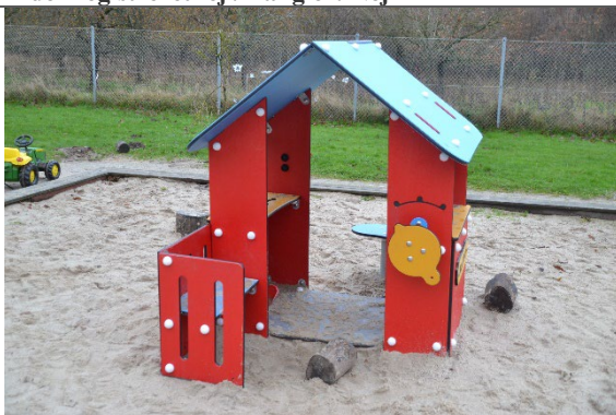
Redskab: Legehus Årgang: 2021 Producent: Kompan Er redskabet mærket: Ja Er der registreret fejl/mangler: Ja