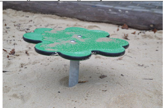
Redskab: Sandbord Årgang: 2021 Producent: Kompan Er redskabet mærket: Ja Er der registreret fejl/mangler: Nej