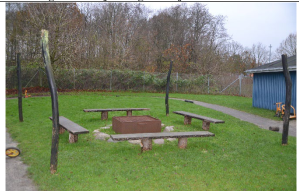
Redskab: Bålsted med stolper til læsejl Ikke omfattet af DS/EN 1176