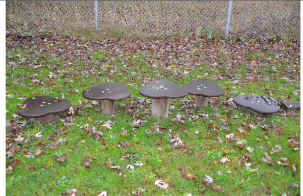
Redskab: Balanceplader Årgang: 2021 Producent: Kompan Er redskabet mærket: Ja Er der registreret fejl/mangler: Nej