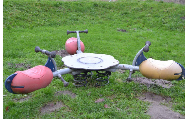
Redskab: Vippe Årgang: 2009 Producent: Kompan Er redskabet mærket: Ja Er der registreret fejl/mangler: Nej