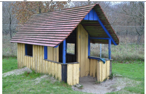
Redskab: Legehus Årgang: 2000 Producent: Trælasten Er redskabet mærket: Er der registreret fejl/mangler: Ja