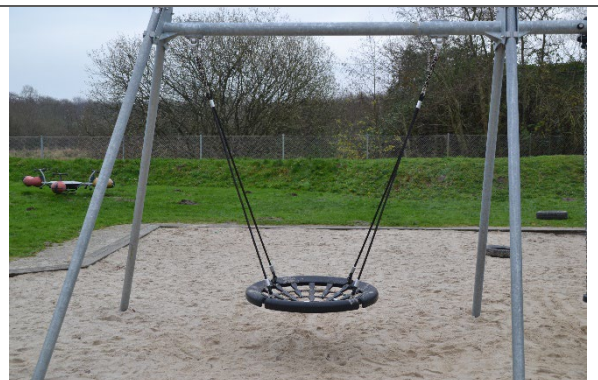
Redskab: Fugleredegynge Årgang: 2021 Producent: Kompan Er redskabet mærket: Ja Er der registreret fejl/mangler: Nej