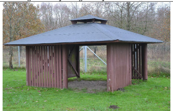
Redskab: Madpakkehus Ikke omfattet af DS/EN 1176