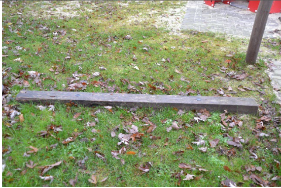
Redskab: Balancestolpe Årgang: 2021 Producent: Kompan Er redskabet mærket: Ja Er der registreret fejl/mangler: Nej