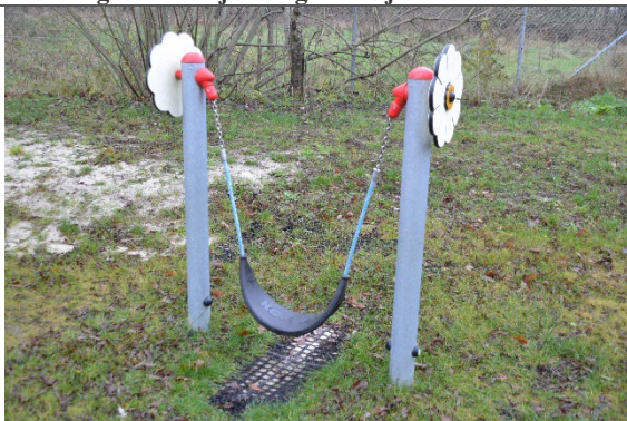
Redskab: Mavegynge Årgang: 2021 Producent: Kompan Er redskabet mærket: Ja Er der registreret fejl/mangler: Nej