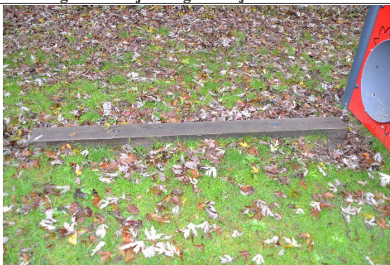
Redskab: Balancestolpe Årgang: Producent: Er redskabet mærket: Er der registreret fejl/mangler: