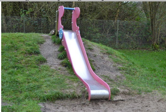
Redskab: Terrænrutsjebane Årgang: 2009 Producent: Kompan Er redskabet mærket: Ja Er der registreret fejl/mangler: Nej