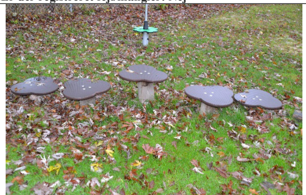
Redskab: Balanceplader Årgang: 2021 Producent: Kompan Er redskabet mærket: Ja Er der registreret fejl/mangler: Nej