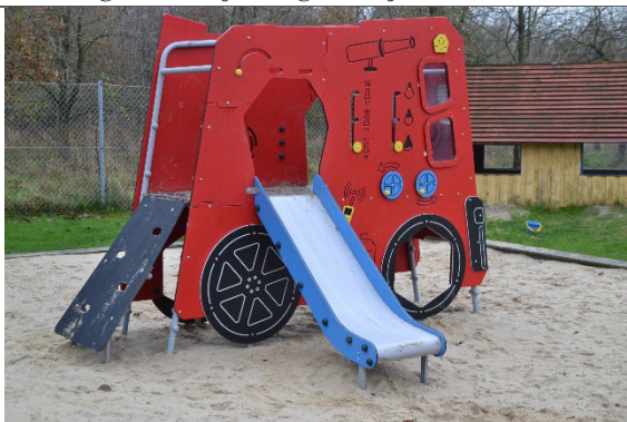
Redskab: Klatrestativ med rutsjebane Årgang: 2021 Producent: Vinci Play Er redskabet mærket: Ja Er der registreret fejl/mangler: Nej