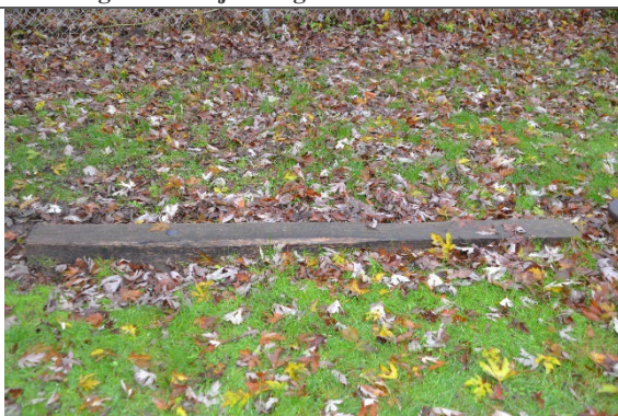
Redskab: Balancestolpe Årgang: 2021 Producent: Kompan Er redskabet mærket: Ja Er der registreret fejl/mangler: Nej