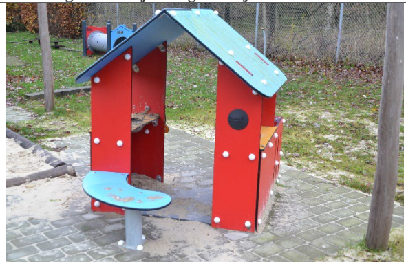
Redskab: Legehus Årgang: 2021 Producent: Kompan Er redskabet mærket: Ja Er der registreret fejl/mangler: Ja