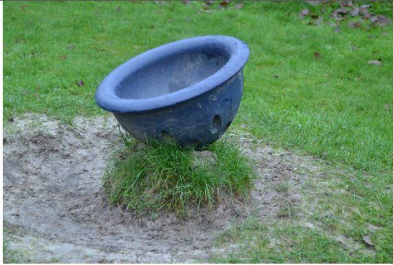
Redskab: Tekop Årgang: 2009 Producent: Kompan Er redskabet mærket: Ja Er der registreret fejl/mangler: Nej