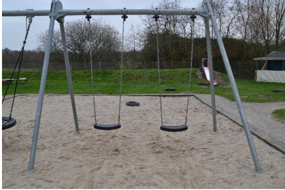
Redskab: Gyngestativ Årgang: 2021 Producent: Kompan Er redskabet mærket: Ja Er der registreret fejl/mangler: Nej