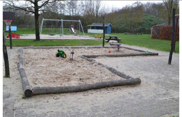
Redskab: Sandkasse med stolper til læsejl Årgang: 2009 Producent: Kompan Er redskabet mærket: Nej Er der registreret fejl/mangler: Nej