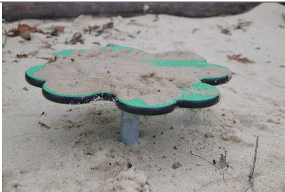
Redskab: Sandbord Årgang: 2021 Producent: Kompan Er redskabet mærket: Ja Er der registreret fejl/mangler: Nej