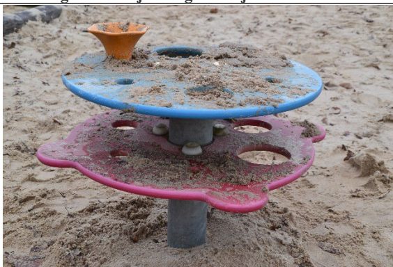
Redskab: Sandbord Årgang: 2009 Producent: Kompan Er redskabet mærket: Ja Er der registreret fejl/mangler: Nej